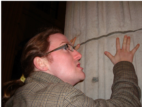
En meget oprevet turist omfavner posthusets store stolper

De indledende forberedelser til turen gik mest med en dybdeborende research omkring Dublins kulturliv, og hvad der ellers kunne være interessant at undersøge/besøge på vores todagesvisit. Efter adskillige timers udmattende diskussioner blev vi enige om, at vi skulle se det gamle, stolte posthus, som lå i hjertet af Dublin.