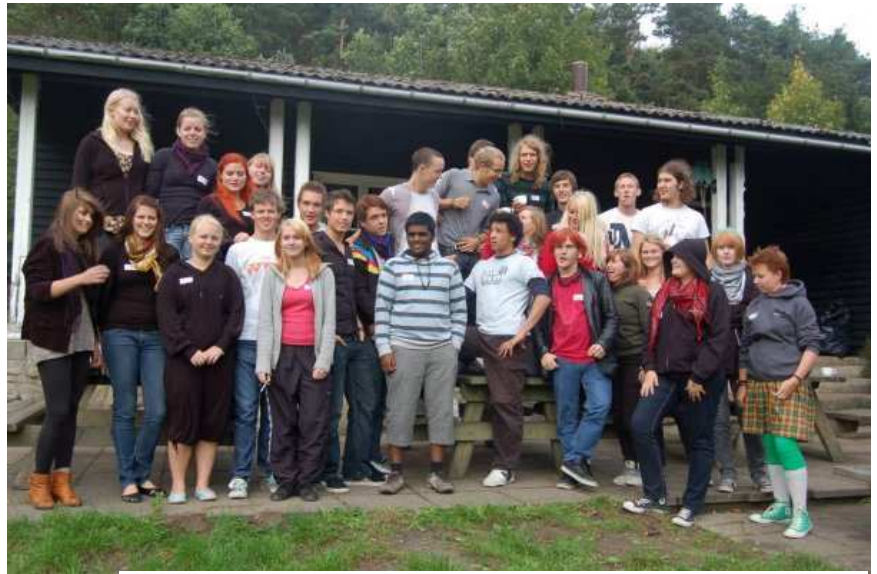
Elevrådet samlet, billede fra elevrådets hyttetur september

Derudover har der to gange i året indtil videre været fredagscafé , som vi jo også står for, og fredagscaféudvalget lover at der kommer endnu én, så det kan vi jo se frem til. Det har været musik, øl, klippe-klistre,