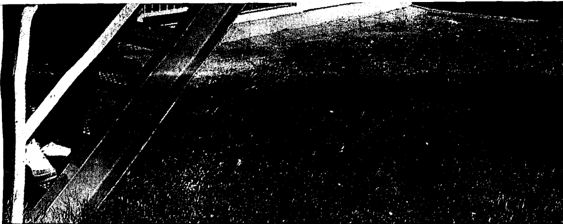
2.x stiftede bekendtskab med den amerikanske gæstfrihed i næsten tre uger.